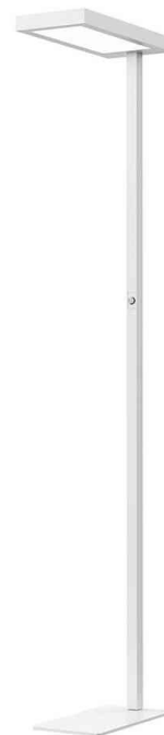
LED-Stehleuchte Jaspis, weiß