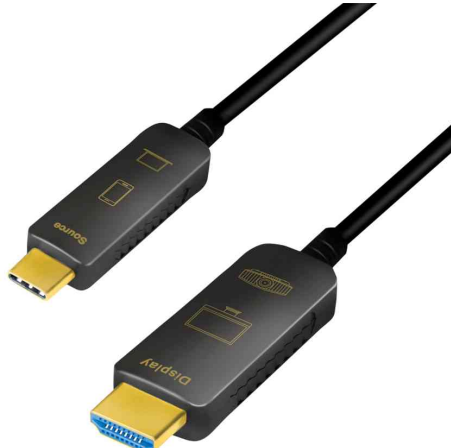
USB 3.2-C AOC Hybrid Glasfaserkabel

- für eine verlustfreie Audio-/Video-Signalübertragung