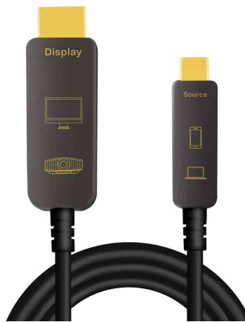
USB-C AOC Hybrid Glasfaserkabel