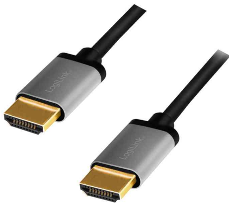
HDMI 2.0 Anschlusskabel, A-Stecker - A-Stecker