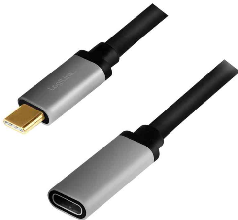
USB 3.2 (Gen2) Verlängerungskabel