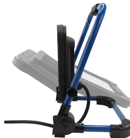
LED-Arbeitsstrahler LUMINARY FL4500AC, Verstellwinkel