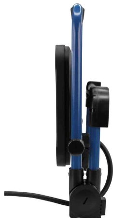
LED-Arbeitsstrahler LUMINARY FL4500AC, zusammengeklappt