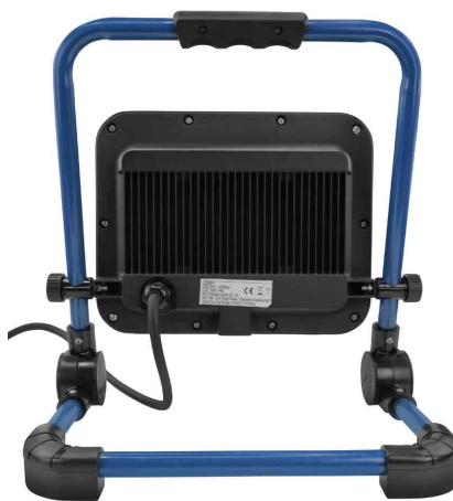
LED-Arbeitsstrahler LUMINARY FL4500AC, Rückansicht