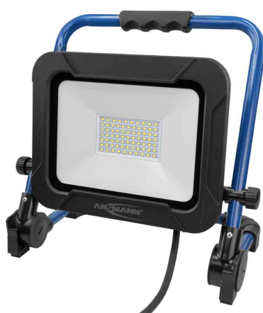
LED-Arbeitsstrahler LUMINARY FL4500AC