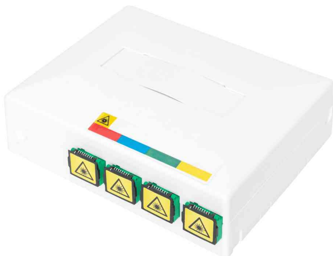
FTTX Leergehäuse mit 4 x SC SX Kupplung