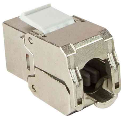
Keystone Modul Kat.6A, geschirmt