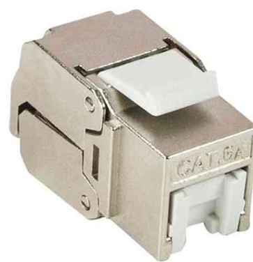
Keystone Modul Kat.6A, geschirmt