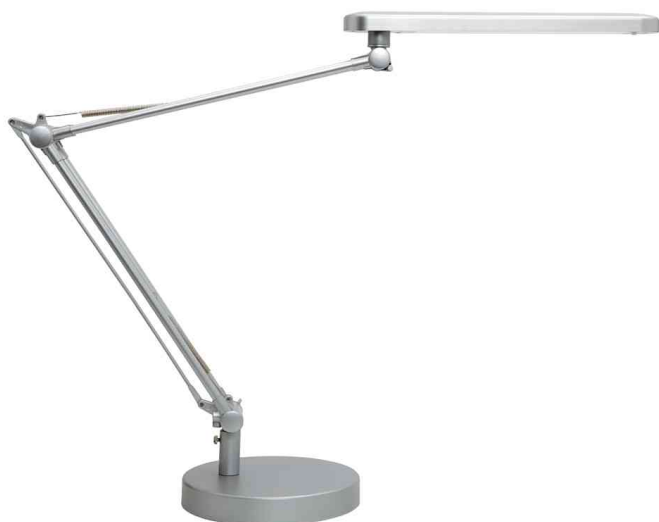
LED-Tischleuchte MAMBO LED 2.0, metall-grau