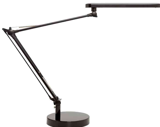
LED-Tischleuchte MAMBO LED 2.0, schwarz