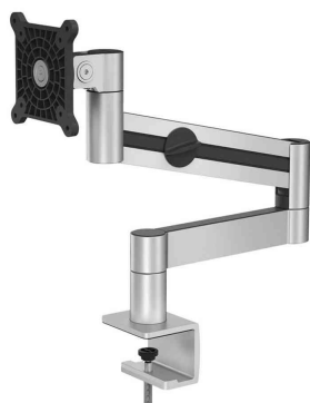
Monitorarm mit Tischklemme