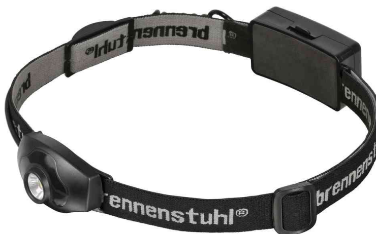
LED-Kopflampe LuxPremium KL100