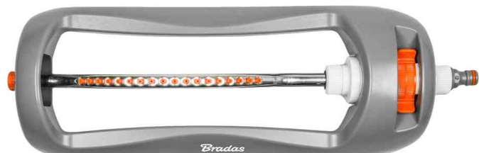
Viereckregner WHITE LINE, 18 Düsen - mit Aluminiumarm

- zur Beregnung von mittelgroßen Flächen