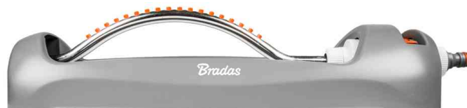
Viereckregner WHITE LINE, 18 Düsen - mit Aluminiumarm