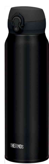
Isolier-Trinkflasche Ultralight, schwarz