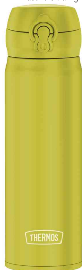
Isolier-Trinkflasche Ultralight, leuchtgrün