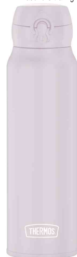
Isolier-Trinkflasche Ultralight, soft pink