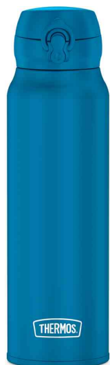
Isolier-Trinkflasche Ultralight, blau