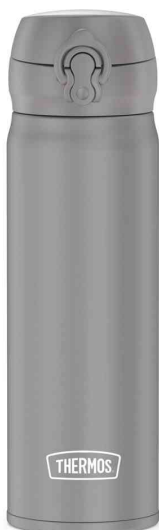
Isolier-Trinkflasche Ultralight, grau