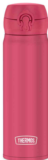
Isolier-Trinkflasche Ultralight, pink