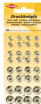
Druckknöpfe, Metall - silber