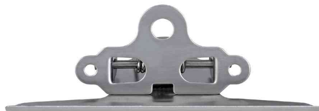
Montageklemmer, Edelstahl, Rückansicht