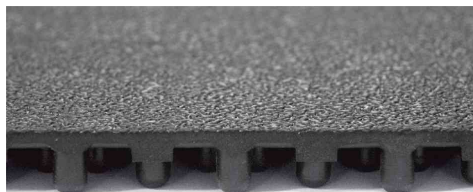
Detailansicht - Profil