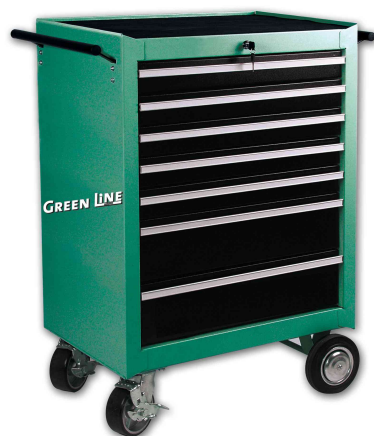
Werkstattwagen, bestückt, 321-teilig