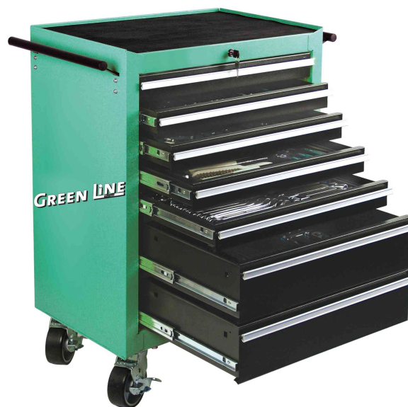
Werkstattwagen, bestückt, 321-teilig