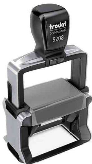
Textstempel Professional 4.0 5208

Zubehör: Ersatzstempelkissen: Abgabe nur in ganzen VE's