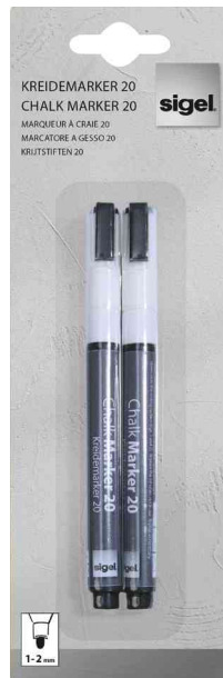
Kreidemarker 20, weiß