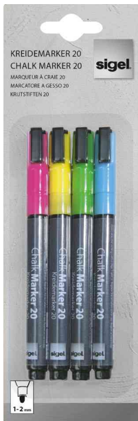
Kreidemarker 20, farbig sortiert