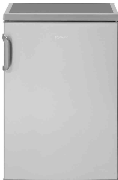
Kühlschrank VS 2195.1, edelstahl - geschlossen