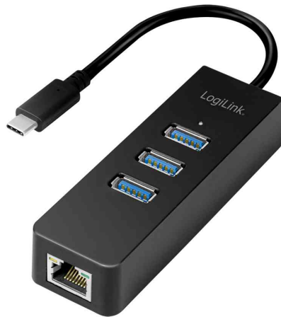
USB 3.0 auf Gigabit Adapter, 3-Port USB Hub