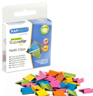
Supaclip® 40, farbig sortiert