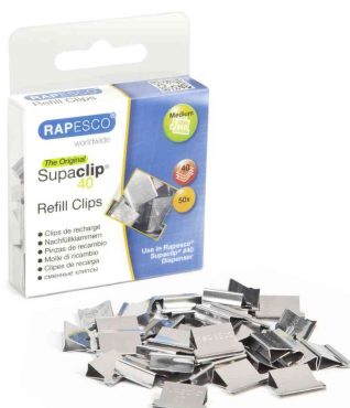
Supaclip® 40, Edelstahl