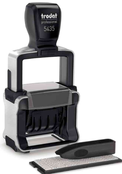
Datumstempel Professional 4.0 Typomatic 5435

- ideal wenn Texte öfter geändert werden