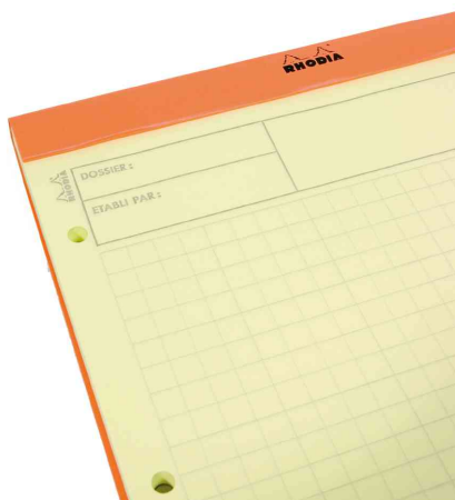
Bloc Audit agrafé, détail