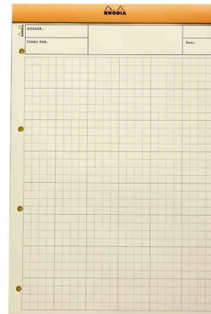
Bloc Audit agrafé, vue intérieure