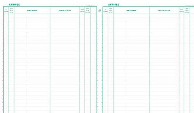
Registre "Enregistrement du courrier", grille