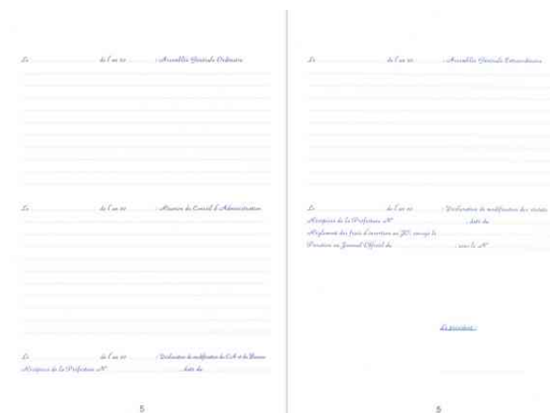
Registre "Registre spécial de l'Association", intérieur