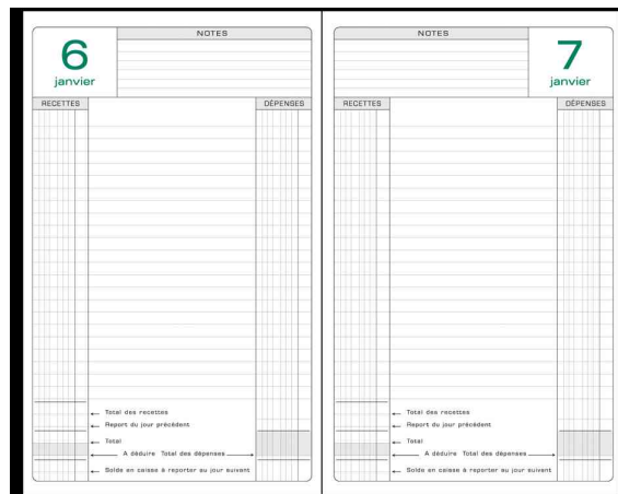
Agenda perpétuel de caisse, ouvert