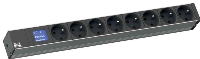
Multiprise 19" "BlueNet BN0500", 8 prises