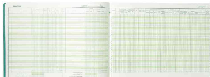
Piûre "Journal des Recettes Dépenses des Professions libérales", ouvert