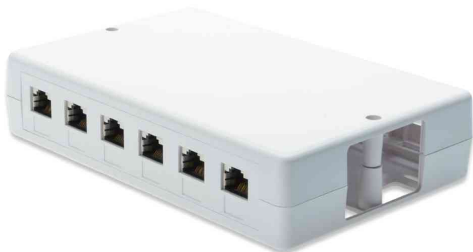
Aufputzbox für Keystone Module, 6-Port

- dient zum Aufbau von Konsolidierungspunkten an Schreibtischen, in Zwischendecken oder in Unterflursystemen