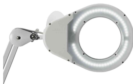
Mit 90 LEDs