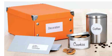
Universal-Etiketten Recycling, Anwendung