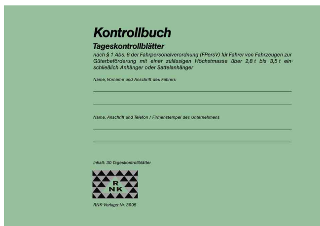
Kontrollbuch, DIN A5 quer