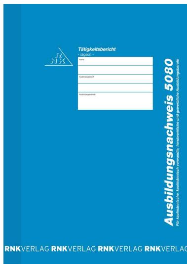
Ausbildungsnachweis-Heft 5080, täglich