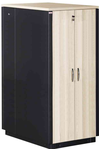
19" SOUNDproof Schrank, ahorn / schwarz