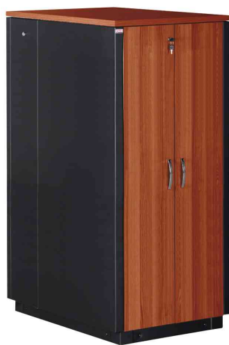
19" SOUNDproof Schrank, kirsche / schwarz