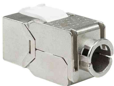
Keystone Modul Kat.6A, Klasse EA, geschirmt, schlanke Bauform