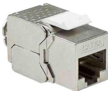
Keystone Modul Kat.6A, Klasse EA, geschirmt, schlanke Bauform