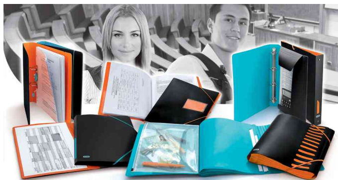
Serie For Students