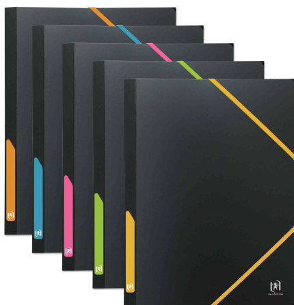
Eckspannermappe XL "For Students"

Weitere Produkte der For Students Serie finden Sie im WebShop!