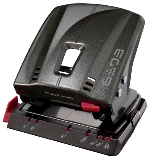
Locher Advanced A6303, taupe