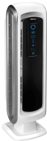
Luftreiniger AeraMax DX5