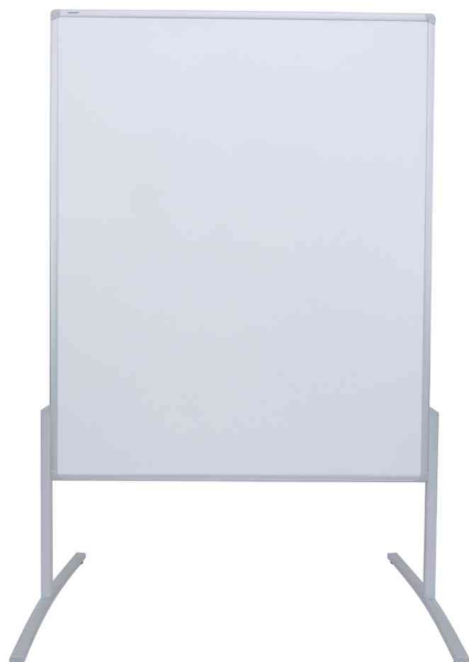
Moderationstafel PRO - Karton