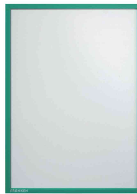
Magnet-Tasche FRAME IT X-tra!Line, grün