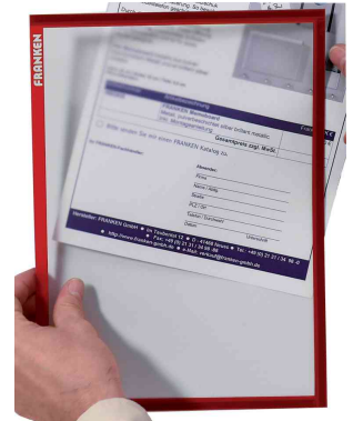
Magnet-Tasche FRAME IT X-tra!Line, rot