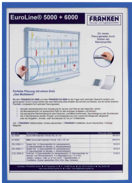
Magnet-Tasche FRAME IT X-tra!Line, blau