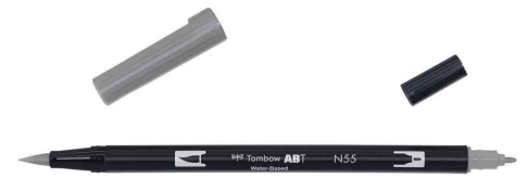
mit 2 Spitzen