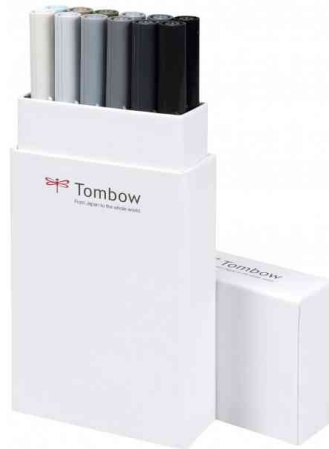
Fasermaler "ABT DUAL BRUSH PEN", 12er-Set Grautöne