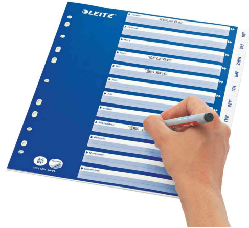
Monate Kunststoff-Register Standard, beschriftet