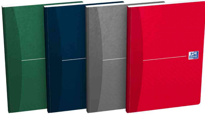
Office Buch "Essentials" - broschiert