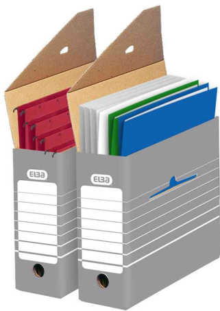
Archiv-Schachtel, (B)95 mm - Lieferung unbestückt