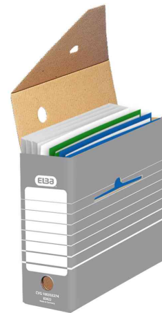
Archiv-Schachtel, (B)110 mm - Lieferung unbestückt